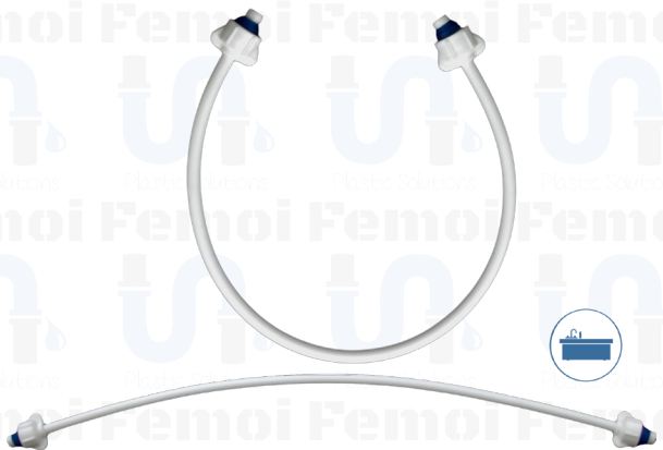
ACOPLE PLÁSTICO FLEXIBLE 60 Cm. 1/2" X 1/2" (Fregadero) C0003