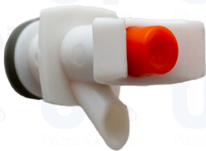
GRIFO P/TERMO STANDARD G0001