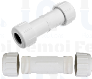
UNION DRESSER DE 1/2" UD0001

Calle San Isidro con 4ta. transversal, Edif. Koral piso 2 Urb. Boleíta Sur | Caracas - Venezuela www.korclass.com | ventasplasticos@korclass.com | +58 212 2349484 | 2399177 | 2355038