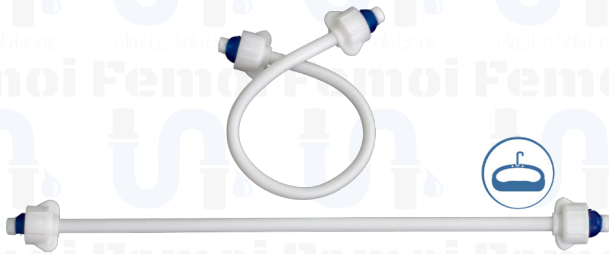
ACOPLE PLÁSTICO FLEXIBLE 1/2" x 1/2" 40 Cm. (Lavamanos) C0001

Calle San Isidro con 4ta. transversal, Edif. Koral piso 2 Urb. Boleíta Sur | Caracas - Venezuela www.korclass.com | ventasplasticos@korclass.com | +58 212 2349484 | 2399177 | 2355038