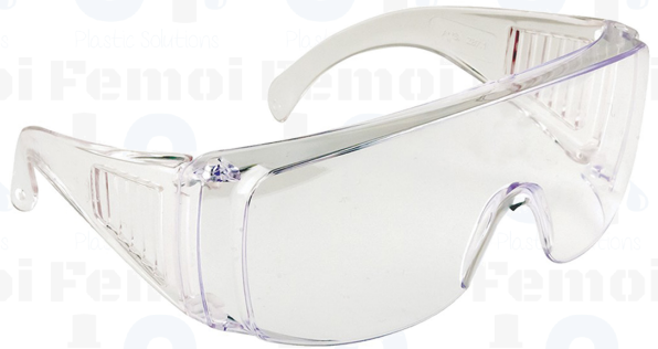
LENTES DE PROTECCIÓN DE POLICARBONATO PROFESIONALES SL001