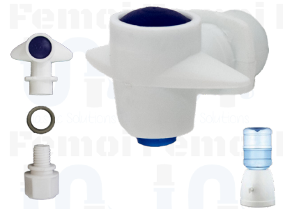
GRIFO DISPENSADOR DE BOTELLON (CHURUN MERU) G0003