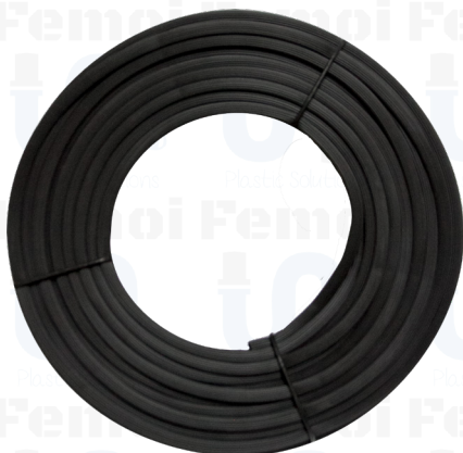
MANGUERA ESTRIADA PVC MULTIUSO 3/8"