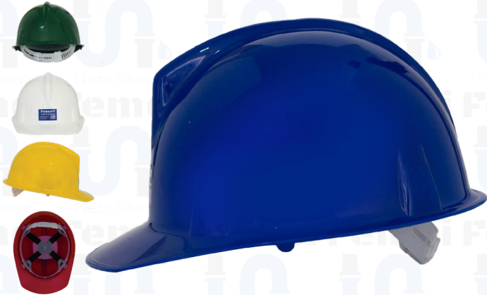
CASCO DE SEGURIDAD PROFESIONAL AJUSTABLE SC002

Calle San Isidro con 4ta. transversal, Edif. Koral piso 2 Urb. Boleíta Sur | Caracas - Venezuela www.korclass.com | ventasplasticos@korclass.com | +58 212 2349484 | 2399177 | 2355038