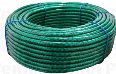
MANGUERA JARDIN REFORZADA DE 1/2" + CONEXIÓN DE 3/4" REINFORCED GARDEN HOSE