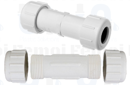
UNION DRESSER DE 1" UD0003