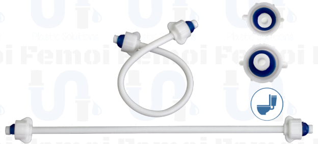
ACOPLE PLÁSTICO FLEXIBLE 1/2" x 5/8" 40 Cm. (W.C.) C0002