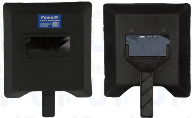
CARETA DE SOLDADOR TIPO CHUPETA CON VIDRIO SC001