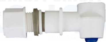
GRIFO P/TERMO HEAVY DUTY G0002