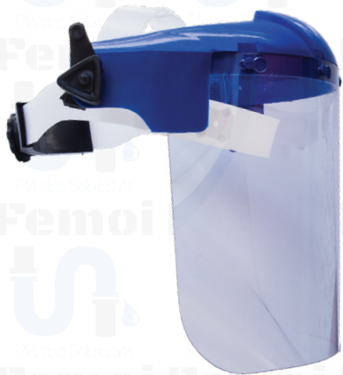
MASCARA DE PROTECCIÓN FACIAL / POLICARBONATO SM001