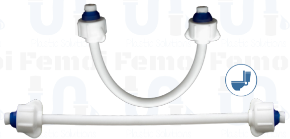
ACOPLE PLÁSTICO FLEXIBLE 25 CMS. 1/2" X 5/8" (W.C.) C0004