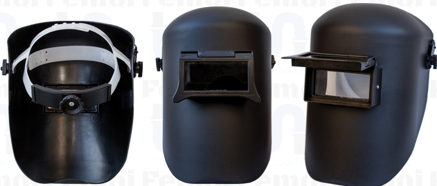
MÁSCARA DE SOLDADOR PROFESIONAL CON VIDRIO SM002